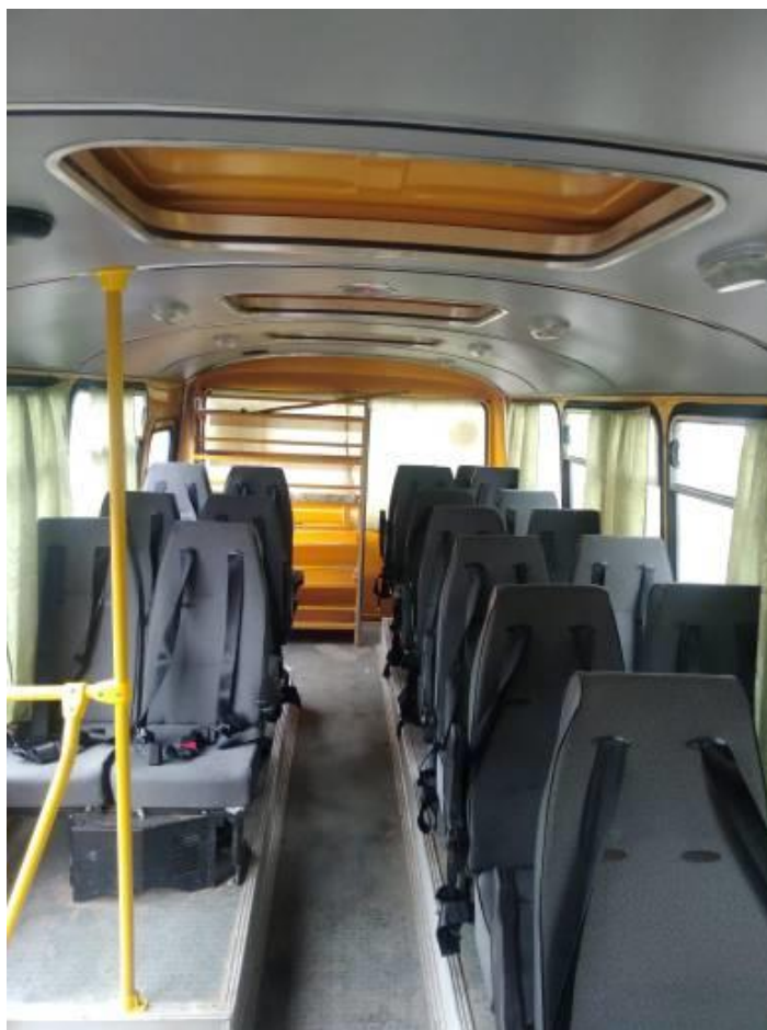
Обзорная фотография с крайней задней точки